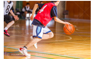
コンプレッションの ウェアではない