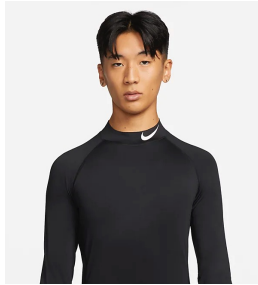
ロゴが入っている