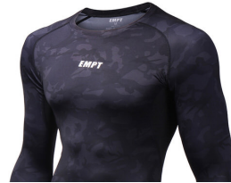
模様があるが 単色と認定できます。