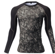
模様がある。単色ではない。