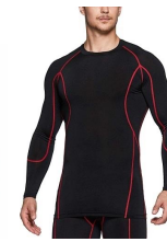
ラインに同系色では 無い色がついてる